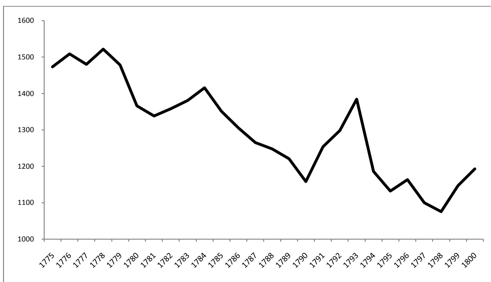
Gráfico II. Salario real medio masculino en Madrid (1775-1800)